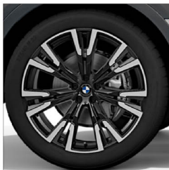
V 輻式 756