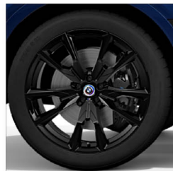
M V 輻式 755M