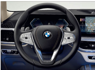
跑車多功能真皮方向盤 (含換檔撥片)