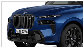
X7 M60i xDrive