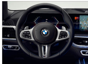
M 多功能真皮方向盤搭配專屬縫線 (含換檔撥片)