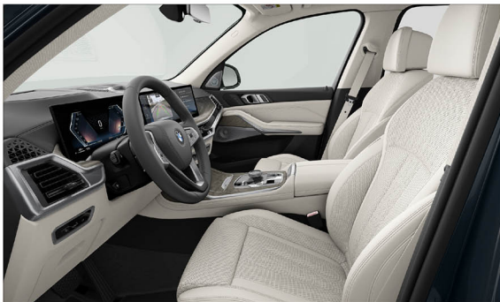
BMW Individual Merino 真皮 / 舒適型座椅 X7 xDrive40i