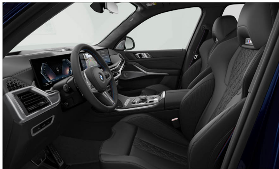
BMW Individual Merino 真皮 / M跑車座椅 X7 M60i xDrive